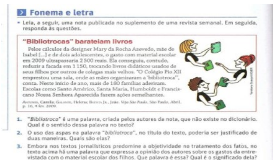
Figura 01: Recorte de Ramos (2013) sobre “Fonema e letra”.

No capítulo 22, por exemplo, intitulado de “A língua no microscópio”, no tópico “fonema e letra”, é apresentado um texto que trata sobre a mudança da palavra “biblioteca” para a palavra “bibliotroca”, em referência a práticas de mães de alunos/alunas que trocam livros usados de seus filhos, de suas filhas, por livros didáticos de outros/outras colegas mais velho(a)s, para economizar na compra desse material escolar. Vejamos um recorte.