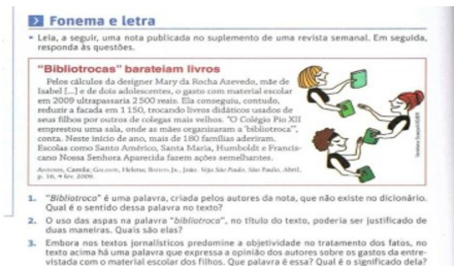
Figura 01: Recorte de Ramos (2013) sobre “Fonema e letra”.

No capítulo 22, por exemplo, intitulado de “A língua no microscópio”, no tópico “fonema e letra”, é apresentado um texto que trata sobre a mudança da palavra “biblioteca” para a palavra “bibliotroca”, em referência a práticas de mães de alunos/alunas que trocam livros usados de seus filhos, de suas filhas, por livros didáticos de outros/outras colegas mais velho(a)s, para economizar na compra desse material escolar. Vejamos um recorte.