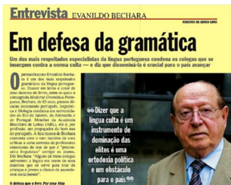
Figura 01: Recorte da primeira página da entrevista de Bechara na revista Veja.