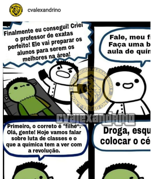
Figura 01 - Meme contra utilização do “gênero neutro”.