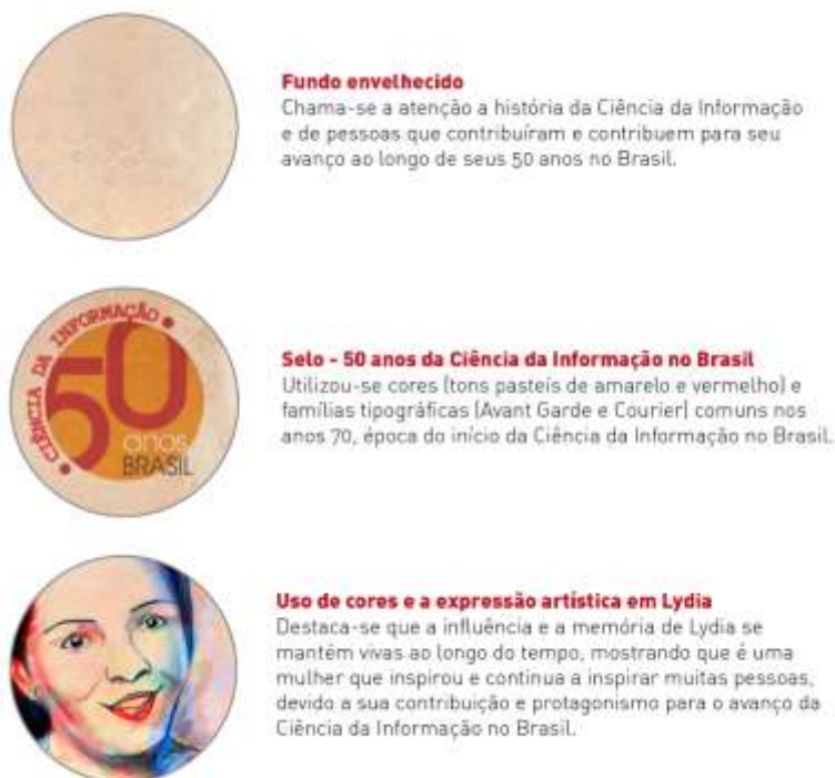
Figura 2 - Conceito de capa e selo comemorativo