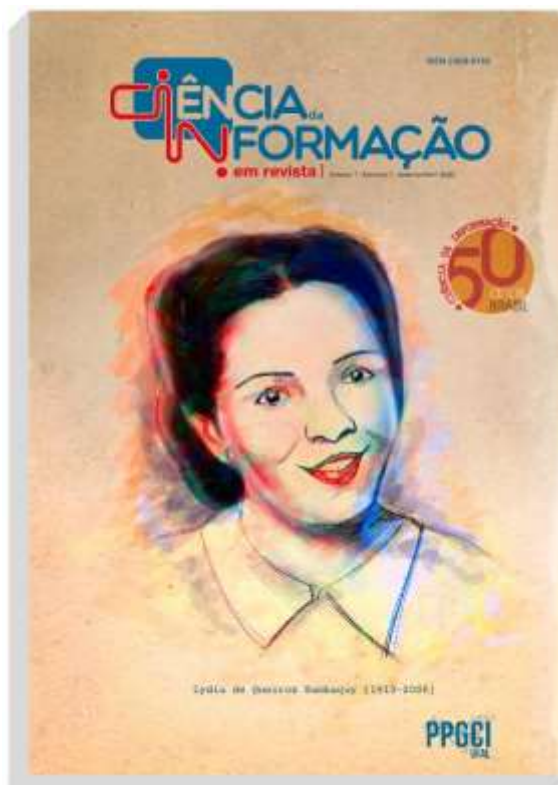
Figura 1 - Capa do v. 7, n. 1, jan./abr. 2020, da Ciência da Informação em Revista

Tomando como referência este contexto institucional, a capa deste número (Figura 1) e o selo comemorativo (Figura 2) foram elaborados, por meio da metodologia TXM Branding, procurando, respectivamente, fazer referência a um dos marcos históricos da área, a partir da homenagem a uma personalidade que contribuiu com esses antecedentes, e registrar um símbolo comemorativo em alusão à passagem dos 50 anos de Ciência da Informação no Bra-