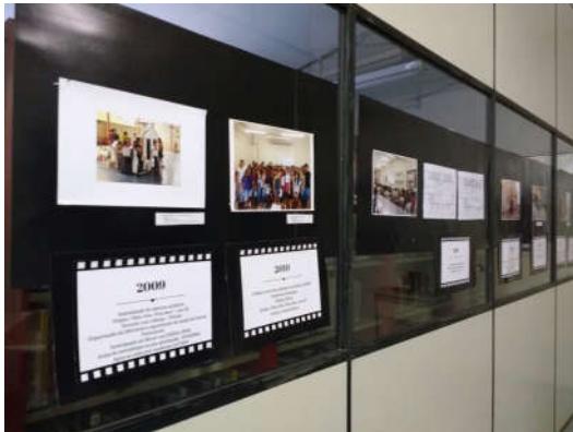
Figura 3 - Exposição cultural

Essas ações possibilitaram a interação cultural e a divulgação da cultura do município, valorizando o trabalho artístico e cultural daqueles que contribuem para o acesso à cultura e a promoção cultural de nosso povo.