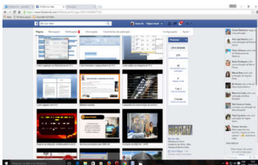
Figura 4 - Divulgação da informação em Rede

O canal de vídeos no Youtube , que também está vinculado a conta do Google, foi criado para que possam ser disponibilizados materiais de apoio ao usuário; lá é possível acompanhar campanhas de preservação do acervo, regras básicas para utilização dos espaços da Biblioteca, além de tutoriais para formatação de trabalhos de conclusão de curso de acordos com as normas da ABNT. As sugestões dos temas abordados podem vir dos próprios usuários com indicações diretas. Os tutoriais são feitos no programa “Cantasia Studio” e disponíveis as sextas-feiras no canal do Youtube , bem como no Facebook da Biblioteca, conforme Figura 4. (UNIVERSIDADE FEDERAL DE PERNAMBUCO, 2017).