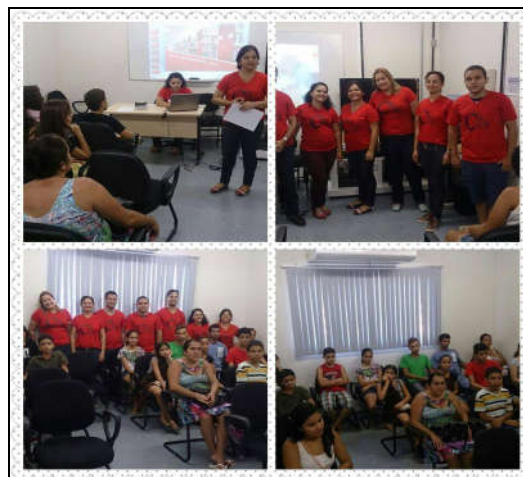
Figura 1: Projeto de extensão Clicav

Registrado na Plataforma do Sistema de Gestão de Projetos- SIGPROJ do Ministério da Educação (MEC), até sua sexta versão, este projeto ofertou 18 minicursos, beneficiando um público de 492 jovens e adolescentes de cidades do interior de Pernambuco. Como resultados a ação de extensão permitiu aos jovens vivenciar o mundo digital, passando a manipular o computador e utilizar as ferramentas tecnológicas. Do mesmo modo, proporcionou aos participantes a oportunidade de conhecer e se aproximar do ambiente universitário, conforme ilustra a Figura 1.