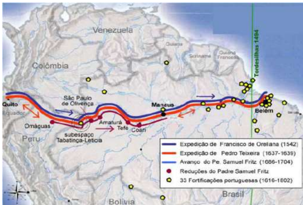
Figura 2. Expedições, reduções espanholas e fortificações na Amazônia.

Elaboração: Adaptado pelo Autor de (RIBEIRO, 2006).