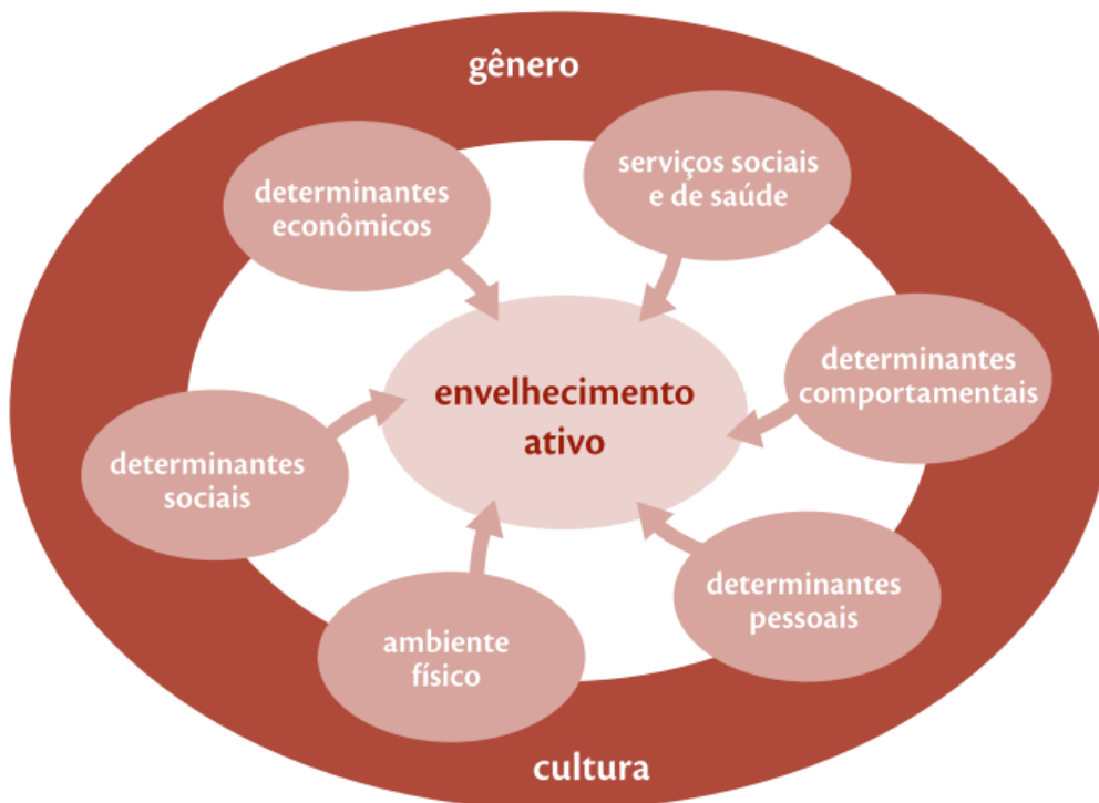
Figura 2. Determinantes do Envelhecimento Ativo.

Além disso, o Envelhecimento Ativo depende de uma gama de influências ou determinantes que regulam indivíduos, famílias e países (OMS, 2008, p. 11). Essas determinantes (Figura 2), quando combinadas, favorecem o sucesso do Envelhecimento Ativo, promovido pelo Estado/Sociedade em prol da qualidade de vida dessa faixa etária.