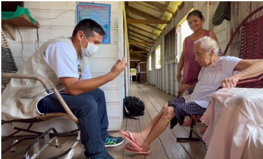
Figura 7. Atendimento domiciliar de paciente idosa.