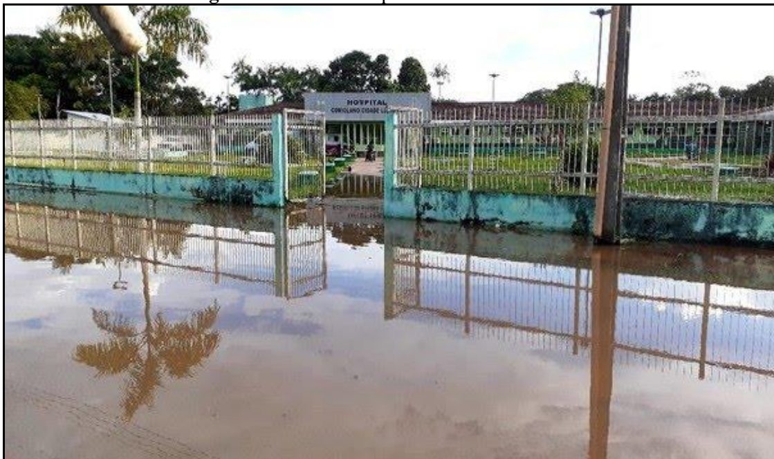
Figura 5. Unidade Hospitalar na cheia de 2021

Outro setor afetado pelas enchentes foram os serviços de saúde pública na cidade. No município, há somente um hospital e as equipes de saúde enfrentam grandes desafios no atendimento ao público, por exemplo, na distribuição de hipoclorito por conta da presença de resíduos na água e na sensibilização das pessoas para que se atentem aos perigos dessa época. No ano de 2021, a unidade hospitalar do município ficou com as vias de acesso alagadas, dificultando a vida dos profissionais e pacientes da cidade. Essa situação aconteceu também em 2009, 2012 e 2014, as maiores enchentes registradas no município, conforme a Defesa Civil local. A figura abaixo retrata a condição do hospital da cidade na enchente de 2021.