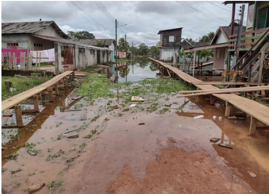
Figura 4. Rua alagada na periferia da cidade.

As vias da cidade ficam, anualmente, alagadas pela subida dos rios e os bairros periféricos são os mais atingidos. As enchentes de 2009, 2012 e 2014 foram as maiores e resultaram em grandes impactos, tanto para as famílias quanto para a própria economia da sede municipal. Os problemas relacionados à acessibilidade são visíveis e perceptíveis periodicamente. Para os idosos, esse fenômeno natural significa uma barreira à acessibilidade que os impede de se deslocarem na cidade.