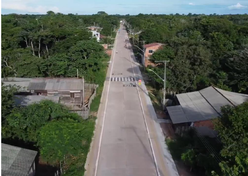
Figura 6. Rua revitalizada na zona norte da cidade