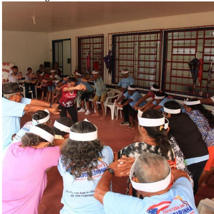
Figura 8. Idosos em atividade na SEMAS