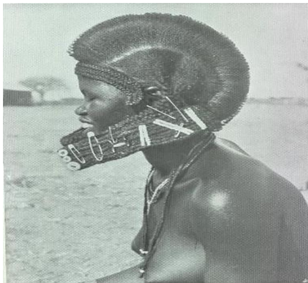
Figura II: Penteado de mulher Humbi casada.