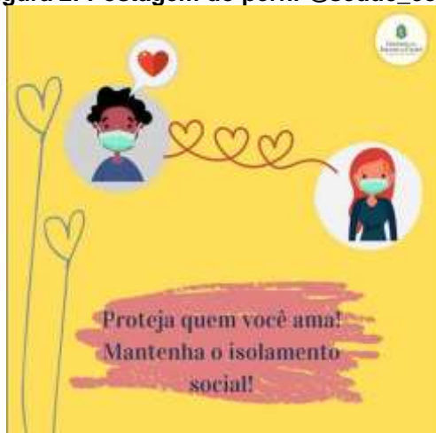
Figura 2: Postagem do perfil @seduc_ceara