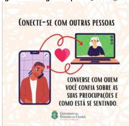
Figura 1: Postagem do perfil @seduc_ceara

similares. Entre os sujeitos, há setas na cor vermelha, que, em espiral, ligam-nos. Entre as setas, uma ilustração em cor vermelha, simulando um coração, é visível. Dois dizeres aparecem na ilustração: 1) Conecte-se com outras pessoas ; 2) Converse com quem você confia sobre as suas preocupações e como está se sentindo .