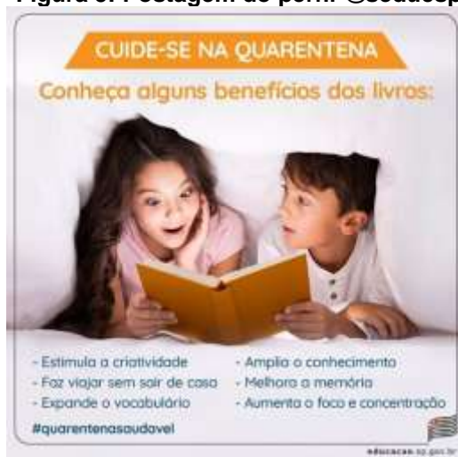
Figura 5: Postagem do perfil @seducsp

Passando, finalmente, à quinta materialidade: temos aqui, um cartaz da Secretaria de Educação do Estado de São Paulo e nele há duas crianças debaixo do cobertor, com um livro em mãos. Ambas as crianças esboçam rostos surpresos e maravilhados com o livro cujo poder é representada por uma luz branca que resplandece sobre o rosto dos infantes. Com o título “Cuide-se na quarentena”, a postagem propõe-se a demonstrar os benefícios dos livros, a seguir enumerados: “ Estimula a criatividade ”; “ Faz viajar sem sair de casa ”; “ Expande o vocabulário ”; “ Amplia o conhecimento ”; “ Melhora a memória ”; “ Aumenta o foco e a concentração ”. Ao final, a postagem contém a hashtag #QuarentenaSaudável.