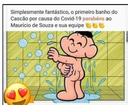
IMAGEM 3: o primeiro banho de Cascão

FONTE: https://www.e-farsas.com/o-personagem-cascão-tomou-banho-pela-primeira-vez-por-causa-do-coronavirus.html Acesso em 23 de maio de 2021