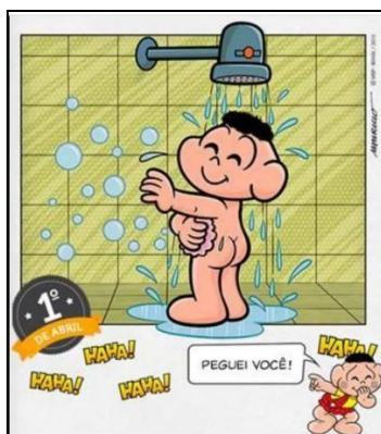
Imagem 4: primeiro de abril