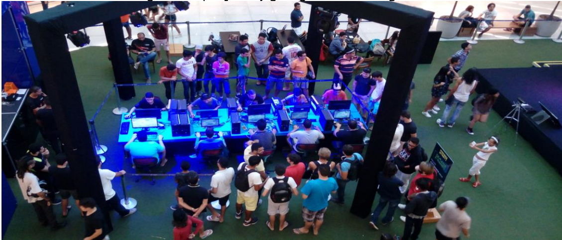
Figura 1 - Exposição de jogos digitais: cultura dos gamers