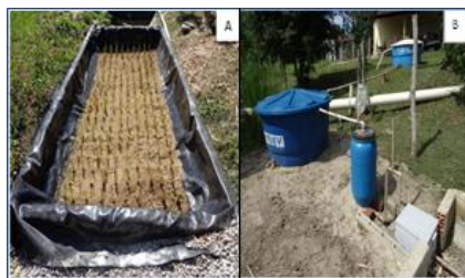
Figura 1 - A: Sistema alagado construído cultivado com arroz; B: Tanque de sedimentação, filtro de brita e filtro orgânico.

O experimento teve duração de 5 meses, sendo conduzido entre março a agosto de 2015. O SAC era alimentado duas vezes por dia com 250 litros de água residuária, de manhã e a tarde, permanecendo no sistema por 41 horas. Foi utilizada a variedade SCS 116 Satoru , com produção de mudas em sementeiras, e transplante de 126 plantas para o SAC após 21 dias. O término do experimento ocorreu com a colheita do arroz em produção, após 143 dias germinados. O sistema alagado construído foi subdividido em setores de um metro, totalizando quatro setores; em cada, foram coletadas 5 plantas ao acaso, excluindo sempre a bordadura. As características analisadas foram: massa seca da raiz e da parte aérea e comprimento de raiz e parte aérea. A massa seca foi obtida através da utilização de estufa a 60°C por 72 horas para secar a raiz e parte aérea. Todos os resultados provenientes das análises foram submetidos ao teste de Tukey com 0,05 de variância para as médias. Foram coletadas do SAC, amostras de água residuária para avaliação da eficiência do sistema, as análises realizadas foram: pH, turbidez, nitrato, fósforo, nitrogênio total Kjeldahl, cor, nitrito, amônia e demanda química de oxigênio (DQO). No Laboratório de Monitoramento Ambiental I – Água e Efluentes do Departamento de Engenharia da UFRRJ foram realizadas as análises, de acordo com o protocolo do Standard Methods for the Examination of Water and Wastewater (APHA, 1999).