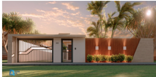
Figura 3 - Projeto autoral do GEBIM UFAL

Um projeto piloto autoral, figura 3, elaborado desde a concepção até o produto final, e, por conseguinte, o projeto do LCCV, figura 4, onde o grupo tem sua sala de permanência, sendo um dos projetos mais completo e complexo modelado pelo grupo.