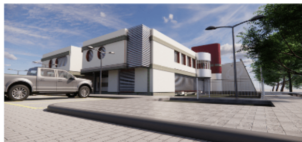
Figura 3 - Modelagem do LCCV na UFAL