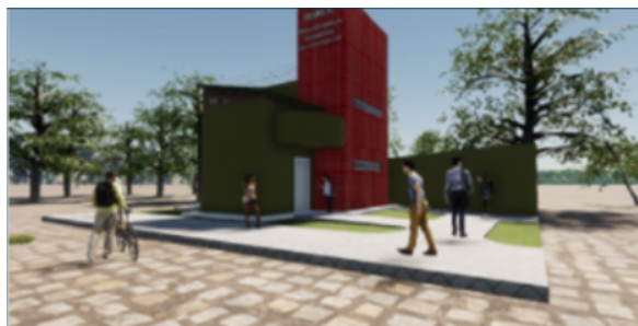
Figura 2 - Modelagem do SisMod na UFAL

A modelagem do Instituto da Computação foi feita de forma colaborativa, onde cada membro da equipe fez-se responsável por uma disciplina, - arquitetura, estrutural, elétrico, hidrossanitário -, utilizando o software Revit da Autodesk como principal ferramenta e o BIM 360 como plugin de gestão das atividades. Além desse, outros projetos também foram desenvolvidos, como o SisMod (figura 2), localizado na UFAL.