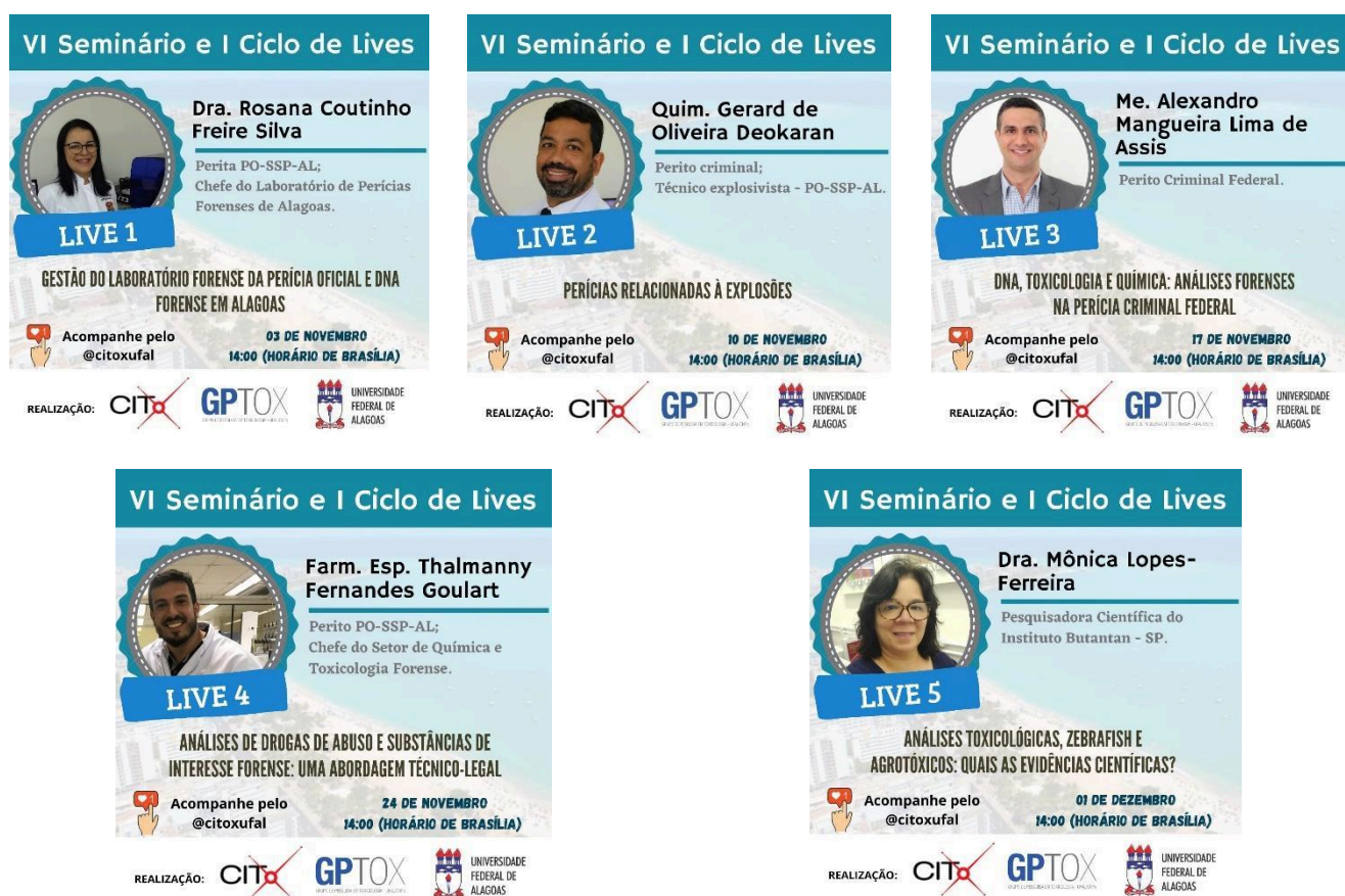
Figura 1: Cards de divulgação palestrantes e temas palestras

Foi necessário comprovar a participação em 100% das Lives para poder receber o certificado com carga horária de 10 horas. Para isso, em cada Live, o/a participante teve um prazo de até 48 horas para assistir e responder ao formulário eletrônico, garantindo a flexibilidade de tempo necessária para aqueles que mantinham concomitantemente outras atividades de estudo ou de trabalho.