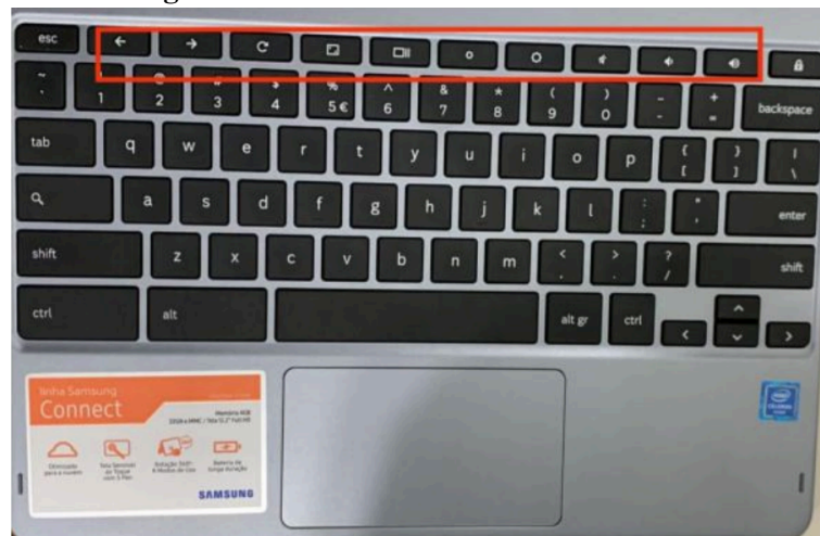
Figura 2. Teclas Exclusivas do Chromebook