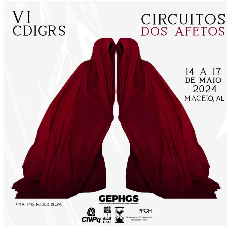
Cartaz do VI CDIGRS