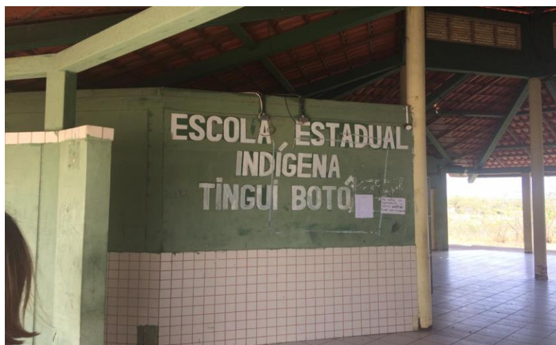
Figura 2 - Escola Estadual Indígena da Aldeia Tingui Botó

A oficina foi ministrada na Escola Estadual Tingui-Botó alojada na própria aldeia indígena, o que facilitou bastante a presença dos envolvidos por ser um ambiente familiar próximo às suas residências.