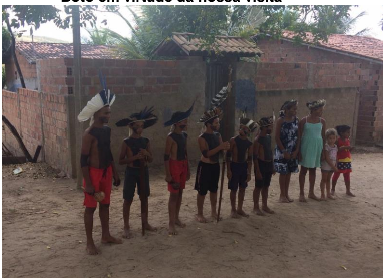
Figura 1 – Apresentação de danças, músicas e rituais dos indígenas da Aldeia Tingui Botó em virtude da nossa visita

Na figura 1 podemos visualizar alguns indígenas da aldeia Tingui Botó apresentando rituais de boas-vindas no momento da nossa primeira visita.