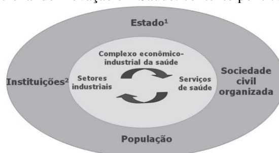
Figura 2 - Sistema Nacional de Inovação em Saúde: contexto político-institucional e produtivo

A figura 2 mostra a caracterização do Sistema Nacional de Inovação em Saúde, apontando o arcabouço produtivo como também a camada sócio-institucional e política que o contém.