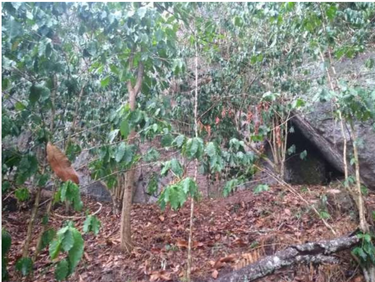
Figura 3: Vista geral frontal do sítio rupestre Cueva de las Caritas.

A primeira visita para confirmação da existência do sítio arqueológico ocorreu no dia 02 de agosto de 2019. Nesta ocasião, se realizou os primeiros trabalhos de identificação e caracterização dos conjuntos gráficos encontrados nos três painéis rupestres (petroglifos). A partir das informações de moradores locais, se visitou o lugar para o procedimento de documentação prévia e geral.