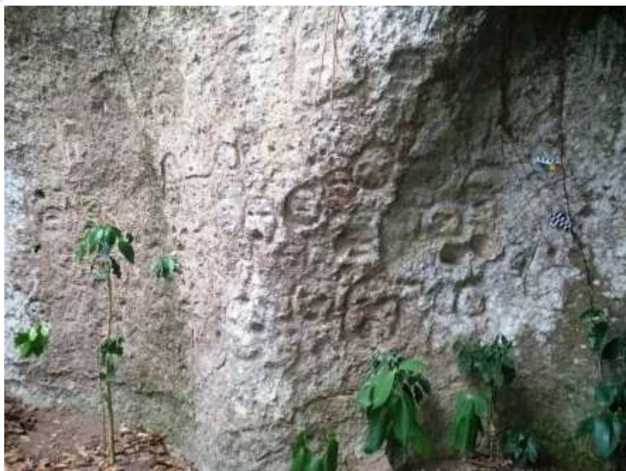
Figura 6: Vista geral do Painel 01. Sítio Rupestre Cueva de las Caritas. (Fonte: Acervo particular dos autores, 2019)