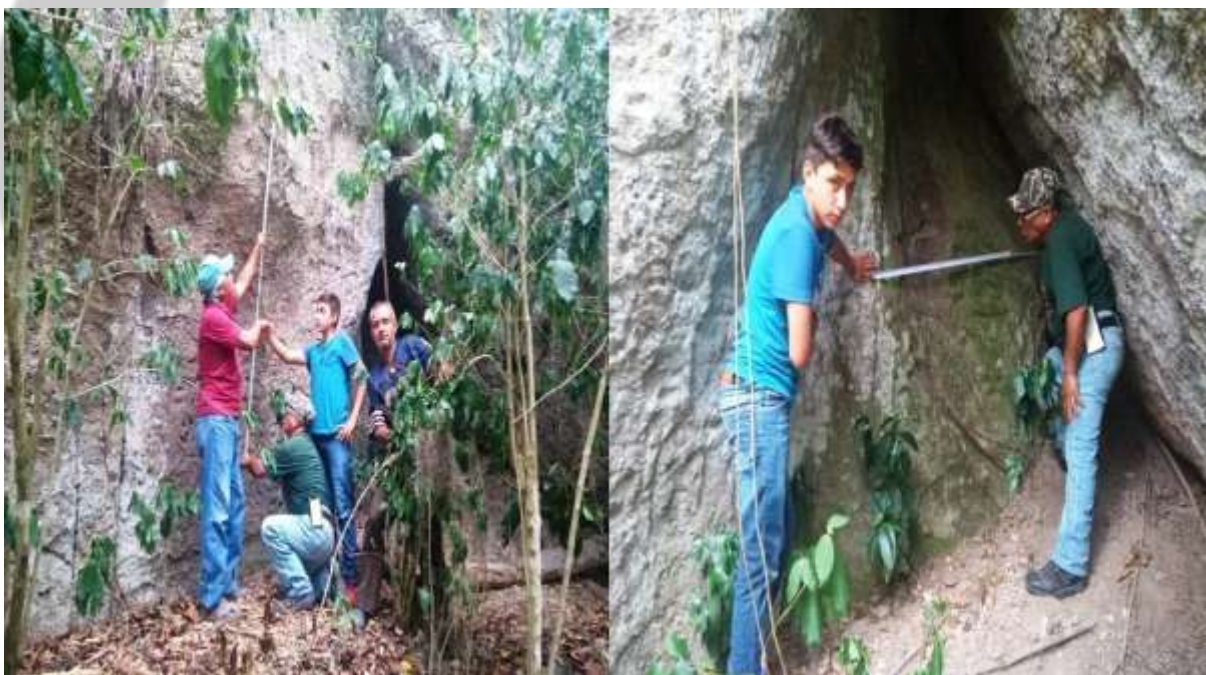
Figura 9: Vista geral dos procedimentos de documentação do sítio rupestre.

Após esse primeiro momento, realizamos os procedimentos de medição do sítio (comprimento + largura + altura), bem como dos três painéis rupestres identificados. Posterior a isso foram tomadas fotos do sítio, dos painéis gráficos e do entorno para uma melhor caracterização e para ordenamento das reflexões pertinentes ao sítio arqueológico e entorno (Figura 09). Análises em computador dos conjuntos rupestres fornecerão dados para se pensar os processos de adaptação, fixação ou passagem de grupos humanos pela região em apreço.