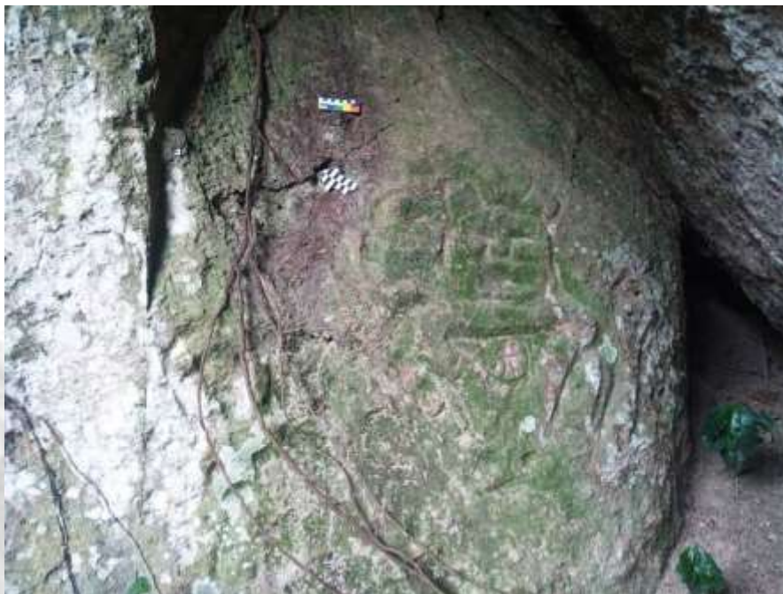
Figura 7: Vista geral do Painel 02. Sítio Rupestre Cueva de las Caritas.