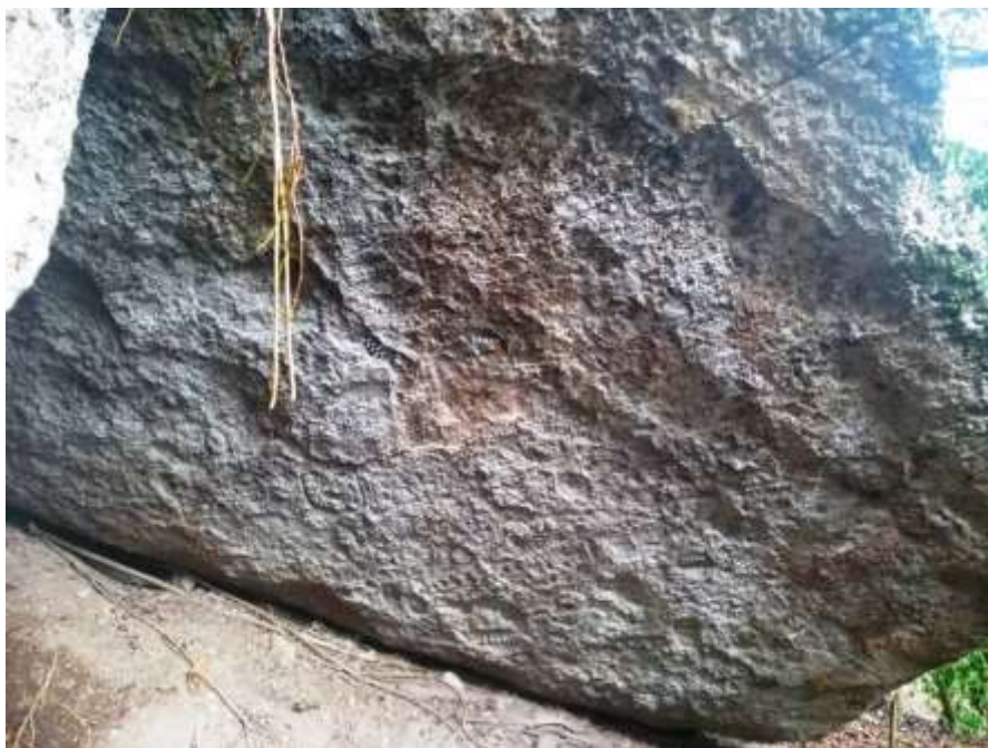
Figura 8: Vista geral do Painel 03. Sítio Rupestre Cueva de las Caritas.