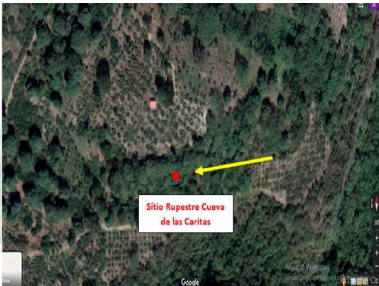
Figura 4: Mapa de localização do sítio arqueológico e contexto geoambiental na região de Chavarrillo Pueblo.

O sítio é único e excepcional por não haver menção do mesmo na literatura sobre o tema na arqueologia mexicana, o que levanta a possibilidade de se encontrar muitos outros elementos arqueológicos na região de Chavarrillo, e em outras zonas do estado de Veracruz. Para um panorama geral do sítio Cueva de las Caritas, observam-se as imagens abaixo, feitas a partir do front do local (Figuras 05), e dos conjuntos gráficos (Figuras 06 a 08).