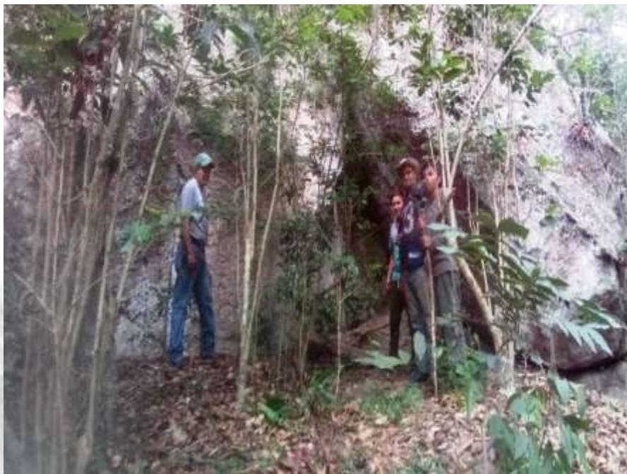
Figura 5: Vista parcial do sítio rupestre com destaque para os moradores locais que nos acompanharam durante a localização do mesmo.