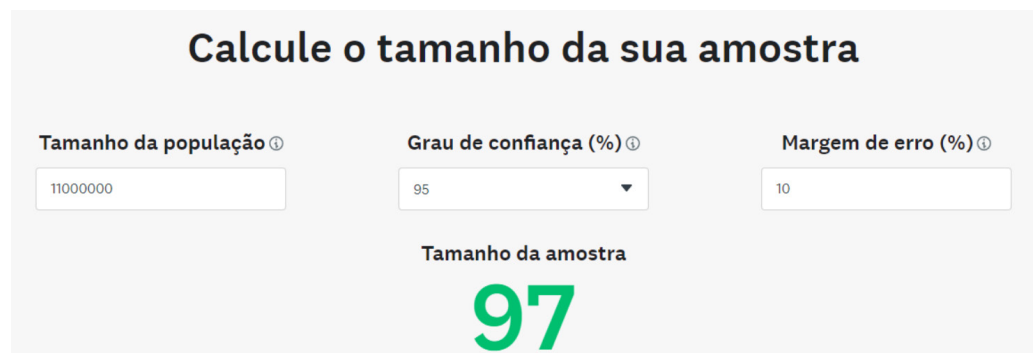
Figura 3 – Cálculo amostral através da plataforma Survey Monkey.

Escolheu-se a ferramenta mencionada para o cálculo amostral após pesquisas iniciais na plataforma Scielo que demonstraram o uso e aplicações de trabalhos que enveredaram por esse caminho. Como resultado,