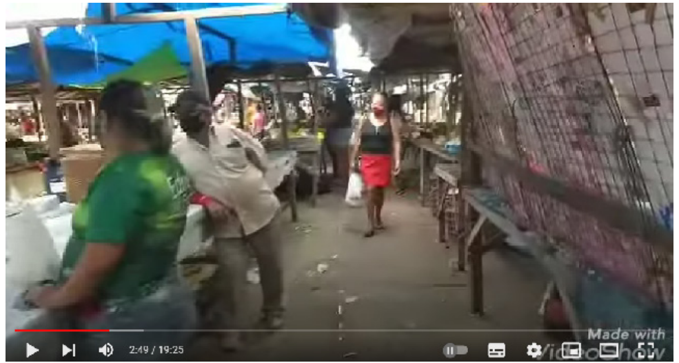
Figura 2 - Frame do vídeo Feira de Delmiro Gouveia Alagoas

4 Vídeo disponível em: https://www.youtube.com/watch?v=pVCSGX5KU4g