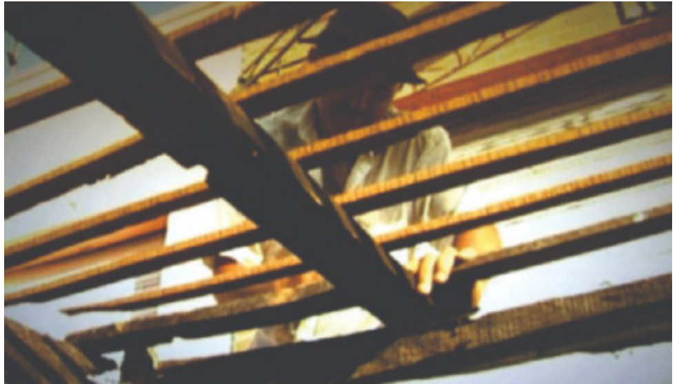
Figura 1 - Still de vídeo do filme A Última Feira

A Última Feira se empenha em relatar o fim daquela feira, pois haverá outra realocação, deixando instalado um sentimento de saudade do local e dos feirantes das barracas vizinhas, que podem vir a se separar com a mudança espacial. Sendo assim, o filme é feliz em relatar as impressões de quem vivencia esse espaço, como um comerciante que não se identificou, mas que mostrava o processo de empacotamento das coisas para a mudança ao local da nova feira, enquanto contava que, provavelmente, haveria desemprego, uma vez que nem todo mundo conseguiria acompanhar todas as mudanças, que estavam saindo praticamente contra suas vontades. É interessante observar, em sua fala, uma certa descrença e indignação ao narrar o questionamento que o prefeito fez a feirantes que trabalham há mais de 30 anos: “você sabe o que é uma feira?”. O homem olha para o entrevistador e devolve com outro pensamento: “Se alguém que há tanto tempo trabalha na feira não sabe o que é uma feira, não há quem saiba. Nós (feirantes) é que estamos no dia a dia trabalhando, nós que sabemos quais melhorias precisam ser feitas”. Uma outra comerciante adverte que, após a feira acabar, haverá uma sensação de vazio naquela parte da cidade, uma vez que o espaço é bastante movimentado, principalmente pela feira.