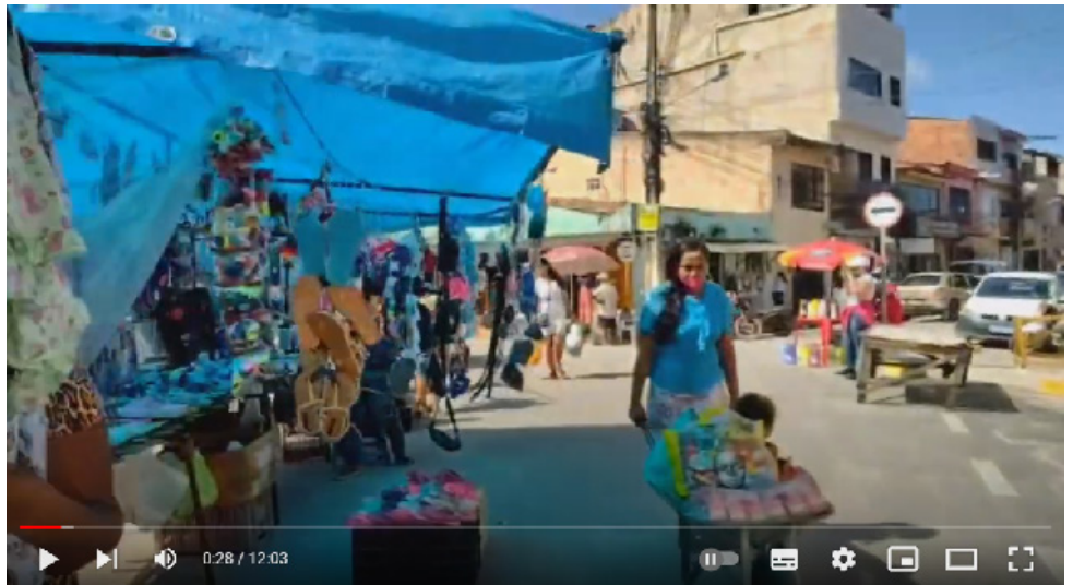
Figura 4 - Frame do vídeo Feira de Maragogi - AL

O conjunto aqui apresentado, como um recorte dentro do acervo de vídeos que acessamos ao longo da pesquisa, nos permite inferir a potencialidade de analisar essas imagens “autoproduzidas” como meio de elencar dinâmicas da territorialidade das feiras livres. Realizados de modo espontâneo e com motivações diversas, os vídeos têm por característica percorrer o espaço, interagir com ele e com as pessoas que o fazem. Em certa medida, esses são também os modos de acesso que preconizamos em nossas metodologias acadêmicas, marcadas por errâncias, entrevistas e registros. Se por um lado, ao assistirmos aos vídeos, o nosso corpo não percorre diretamente os espaços e nem é ele que escolhe os percursos, por outro, ao nos determos um pouco mais nesses registros, que permitem ver, rever, aplicar zoom, recortar e pausar, há outras possibilidades analíticas abertas. Além disso, é certo que as imagens, sons e movimentos emulam em nosso corpo as experiências vivenciadas fisicamente, além de se fazerem pontes de acesso a memórias corporificadas em outras etapas de pesquisa.