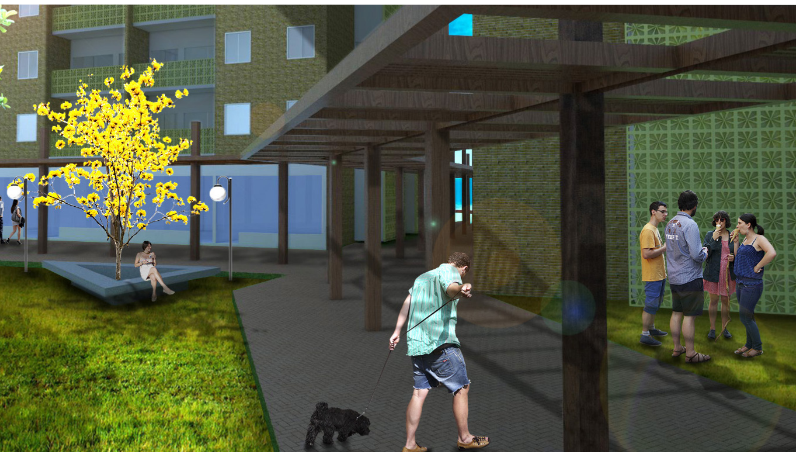
Figura 04 e 05: Perspectivas dos equipamentos urbanos que compõem a proposta de intervenção urbana, na primeira figura a estação intermodal de transportes e na segunda os edifícios de uso misto destinados à habitação de interesse social.