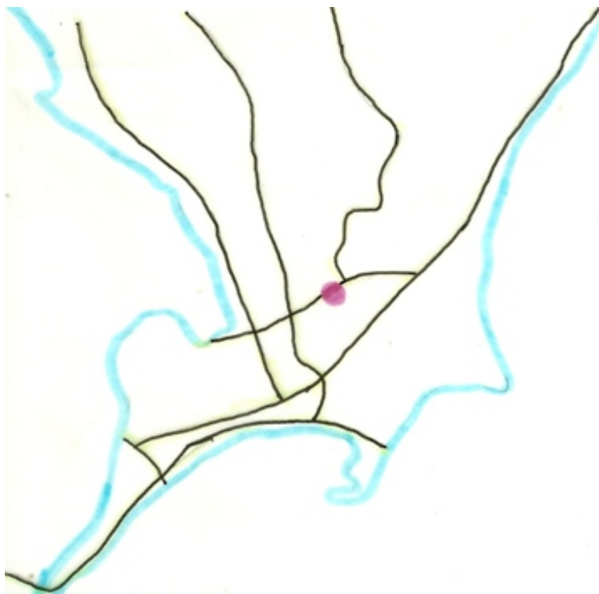
Figura 4: Croqui de situação do Terminal Rodoviário na cidade de Maceió, ponto central entre as principais vias de circulação.

Alguns olhares mais atentos, mesmo que apressados, já que no seu sentido mais primitivo um terminal rodoviário configura-se como lugar de passagem, conseguiram reconhecer que as soluções encontradas pelos projetistas para o Terminal Rodoviário João Paulo II, agregam a obra características marcantes e inusitadas, quando reporta-se a sua estética e funcionalidade. Um edifício que, apesar da depreciação de seus serviços, abre acolhedoramente as portas da cidade.