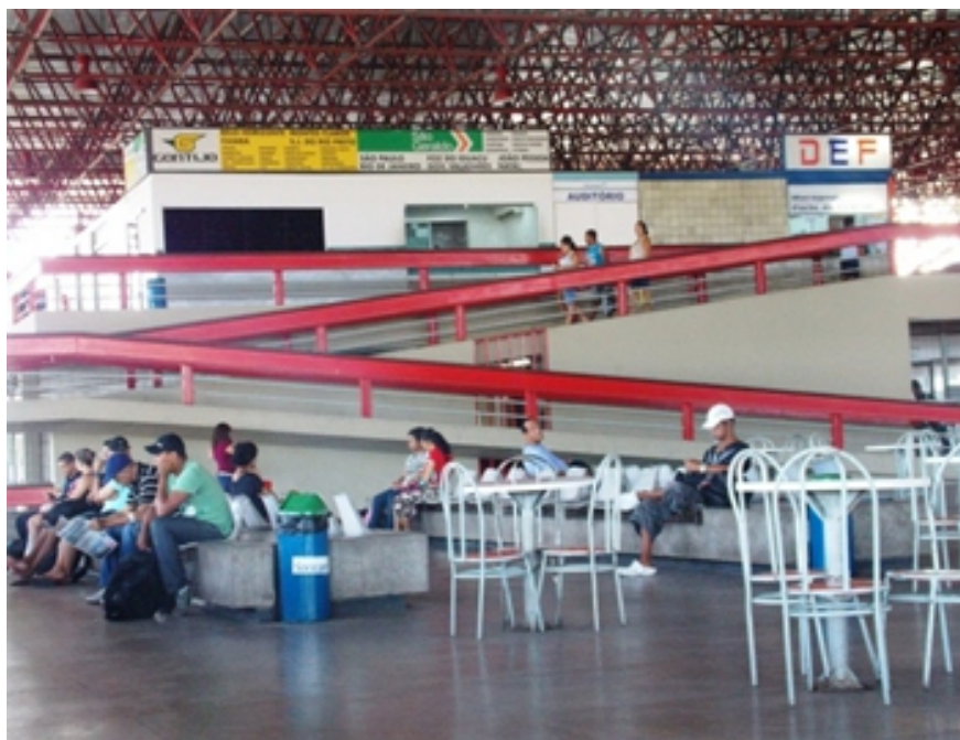
Figura 2: Fotografia da área de espera do embarque do Terminal Rodoviário, ao fundo rampa que dá acesso ao pavimento superior do edifício.

A disposição da planta foi desenvolvida baseada em princípios de rigorosa funcionalidade. A distribuição dos setores favoreceu a circulação das pessoas com a intenção de proporcionar ampla visibilidade das dependências. Os setores de uso e serviços públicos, como também o de operações, foram localizados no pavimento térreo, com o objetivo de não interferir nos percursos de embarque e desembarque, já os setores administrativos e comerciais foram situados no pavimento superior, para que dessa forma, o terminal rodoviário não se confundisse com um centro de comércio e perdesse seu caráter funcional. No entanto, com o passar do tempo, os comerciantes sentiram-se prejudicados, pois a obrigação de subir um andar para efetuar uma compra não era rentável. Então, o posicionamento dos setores foi invertido.