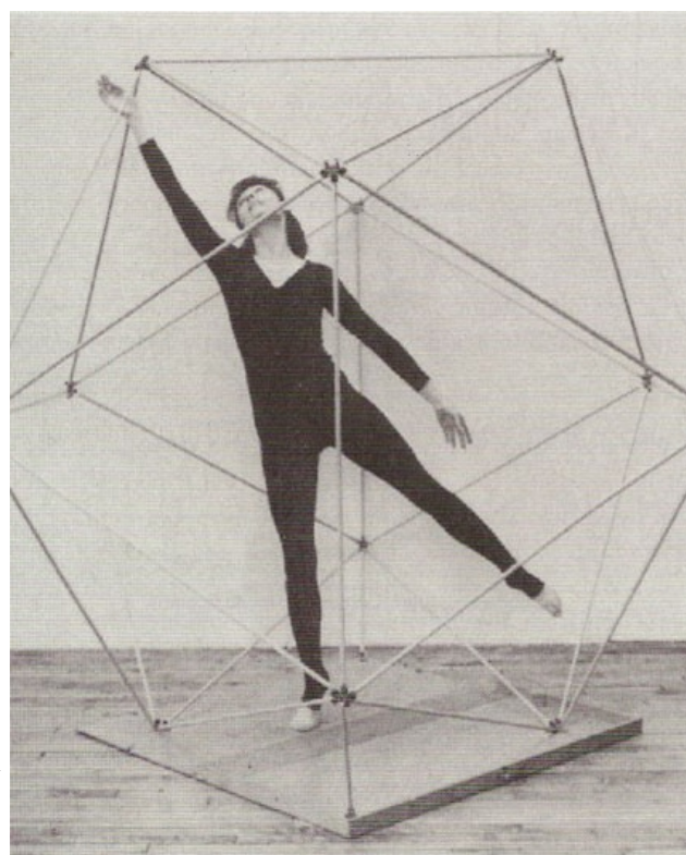
Figura 4: O espaço desenha os movimentos dos corpos ao tempo em que os movimentos delineiam espaços. Jogos dinamosféricos de Rudolf Von Laban (Fonte: Danse et architecture, Editions Contredanse). Fonte: CORIN, Florence. Danse et architecture. Editions Contredanse, 2000.

(...) um templo, um monumento, o parthenon ou uma igreja barroca existe em si por seu peso, sua estabilidade, suas proporções, volumes, espaços mas até que o homem não entre no edifício, não suba os degraus, não possua o espaço numa "aventura humana" que se desenvolve no tempo, a arquitetura não existe, é frio esquema não humanizado. O homem cria com o seu movimento, com os seus sentimentos. Uma arquitetura é criada 'inventada de novo' por cada homem que nela anda, percorre o espaço, sobe uma escada, se debruça sobre uma balaustrada, levanta a cabeça para olhar, abrir, fechar uma porta, sentar e se levantar é um tomar contato íntimo e ao mesmo tempo criar formas no espaço, expressar sentimento; o ritual primogênito do qual nasceu a dança, primeira expressão daquilo que será a arte dramática. (BARDI apud OLIVEIRA 2006, pag. 358)