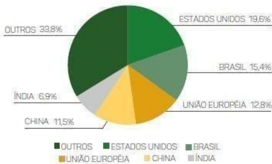
Gráfico 2: Ponderação na produção mundial de carne bovina em 2017.

De acordo com o gráfico 2, o Brasil se encontra em segundo lugar na produção de carne, correspondente a 15,4%, perdendo apenas para os Estados Unidos, representando 19,6%. Interessante notar que em quarto lugar se encontra a China, com 11,5% da produção. Após as situações que a China vem passando, o Brasil aumentou suas exportações de forma significativa para esse país.