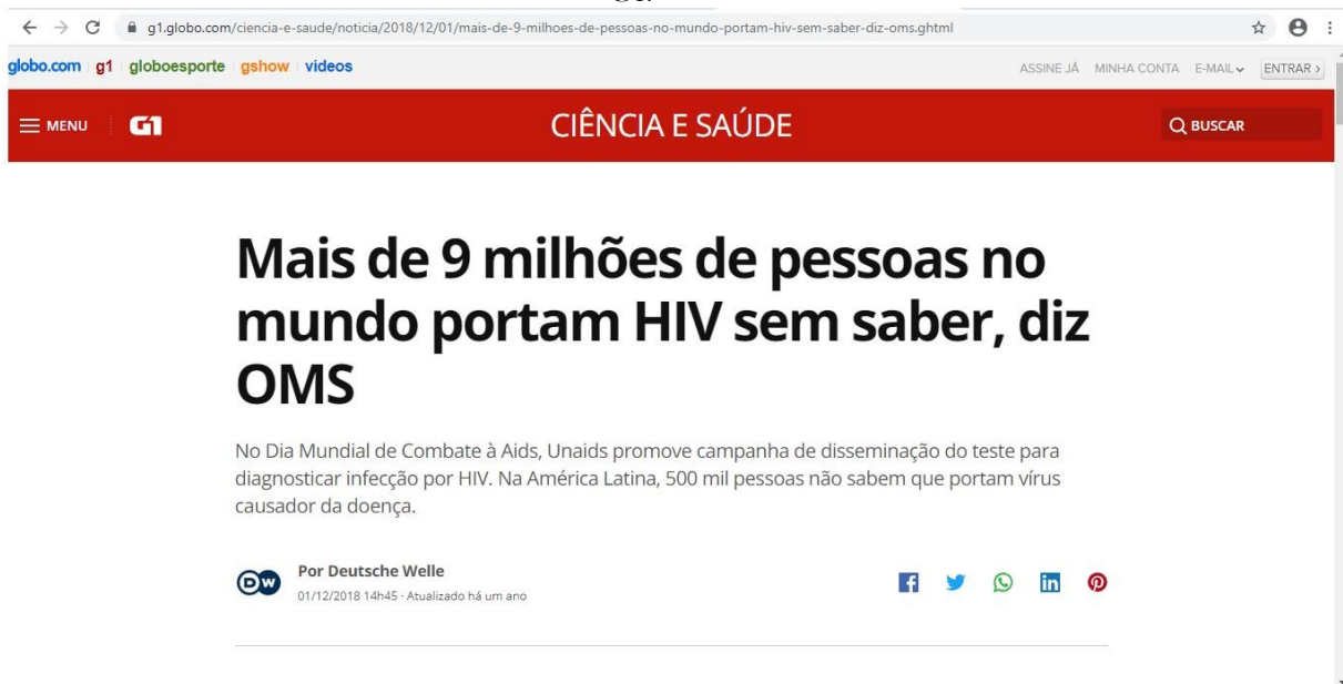
Figura 1: Print da notícia veiculada no site G1.