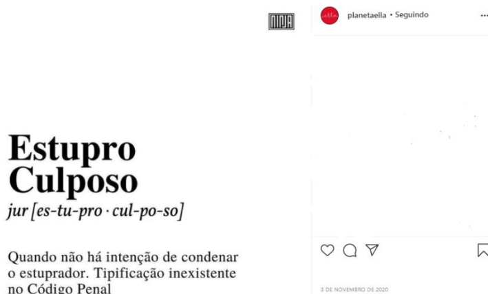
Figura 2: Estupro Culposo.