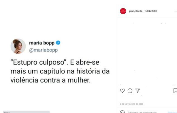
Figura 5: Estupro Culposo.