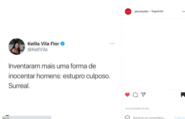
Figura 6: Estupro Culposo.