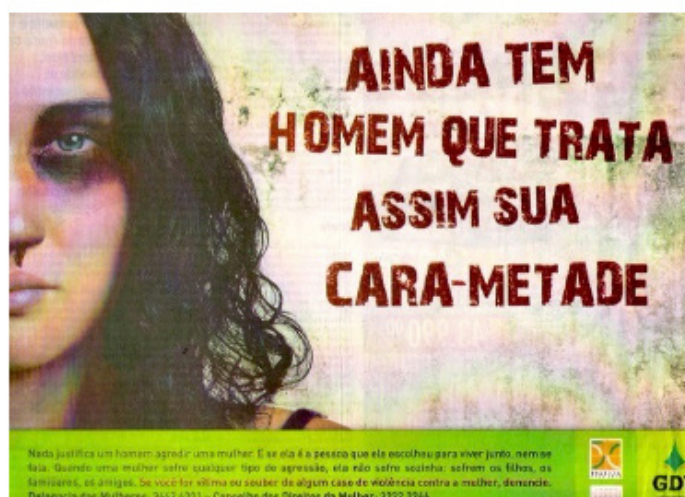
Figura 4: Campanha contra violência doméstica

A última campanha analisada também aborda a violência de gênero. Divulgada pelo Governo do Distrito Federal em 2012, diz: “Ainda tem homem que trata assim sua cara-metade”. Abaixo diz: “Nada justifica um homem agredir uma mulher. E se ela é a pessoa que ele escolheu para viver junto, nem se fala. Quando uma mulher sofre qualquer tipo de agressão, ela não sofre sozinha: sofrem os filhos, os familiares, os amigos. Se você for vítima ou souber de algum caso de violência contra a mulher, denuncie”.