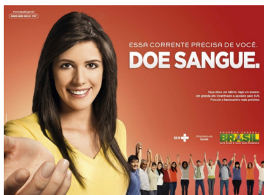
Figura 1: Campanha de doação de sangue

O primeiro se trata de uma campanha de doação de sangue realizada pelo Governo Federal em 2011 para marcar o dia nacional do doador de sangue. Na ocasião, foi lançado um “aplicativo, para a rede social Facebook , capaz de criar um banco de dados para auxiliar na identificação de pessoas disponíveis para uma eventual doação”. No cartaz, vemos uma corrente formada por pessoas que estão de mãos dadas simbolizando a união necessária para salvar vidas. Lê-se: “Essa corrente precisa de você. Doe sangue. Faça disso um hábito. Seja um doador. Um grande ato apoiado e incentivado pelo SUS. Procure o hemocentro mais próximo”.