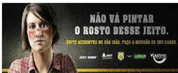
Figura 2: Campanha de prevenção de acidentes

A segunda campanha analisada é de trânsito, realizada em 2012, pela Polícia Rodoviária Federal em parceria com vários órgãos, em quatro cidades baianas. Foi uma campanha com o objetivo de conscientizar a população e, dessa forma, “reduzir o número de acidentes de trânsito ocasionados pelas condutas de risco” presentes na maioria das ocorrências de trânsito. No cartaz, vemos uma mulher vestindo uma camisa com estampa xadrez, remetendo ao período de festas juninas, e também está com o rosto machucado.