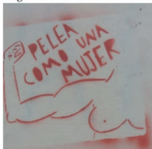
Fotografia 1: “Lute como uma mulher”

têncil, a qual é utilizada para pintar a mesma arte, através de um molde, em diversas superfícies. No mais, vale explicitar que os 7 recortes das análises a seguir estão abreviados como “R” (recorte) e numerados.