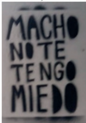
Fotografia 3: “Macho, não tenho medo de ti”