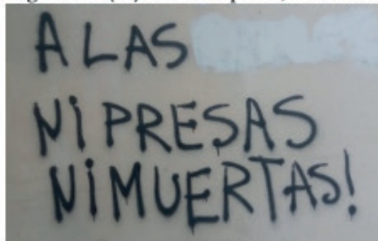
Fotografia 5: “(Às) ruas: nem presas, nem mortas!”

A seguir, na pichação da fotografia 5, o discurso sobre o aborto é expresso pelo sujeito-feminista mais uma vez: