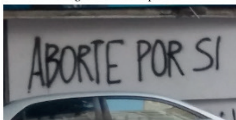
Fotografia 2: “Aborte por si”

Com respeito aos direitos exigidos pelas mulheres, a legalização do aborto, especialmente na Argentina, que consta no Libro segundo de los delitos – Título I – Delitos contra las personas – Capítulo I – Delitos contra la vida , tem sido um tema de destaque nas discussões políticas das últimas décadas. Em 2006, o Proyecto de Ley de Interrupción Voluntaria del Embarazo (Argentina) foi elaborado pela Campaña Nacional por el Derecho al Aborto Legal, Seguro y Gratuito . Após ser apresentado e recusado diversas vezes, esse projeto de lei foi aprovado pelo Congreso de la Nación Argentina no ano de 2020. Desde 1984 até dezembro de 2020, abortar, para a mulher grávida, no caso específico da Argentina, era um crime previsto no artigo 88 da Ley nº 27.347 do Código Penal de la Nación Argentina (ARGENTINA, 1984). A previsão da pena desse crime era de 1 a 4 anos. Esse fato se reflete no discurso urbano cordobense, conforme os dizeres materializados na pichação que segue, realizada com tinta spray :