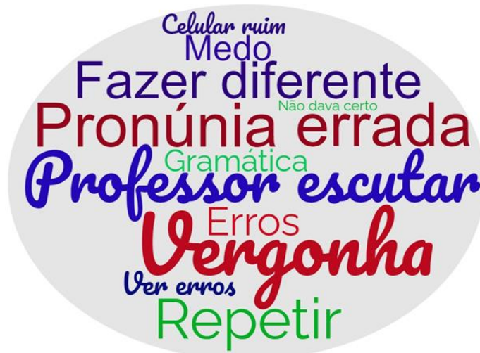
Figura 4: Aspectos negativos do WhatsApp

positivos apresentados, os participantes também revelaram pontos negativos, como vemos na nuvem de palavras apresentada na Figura 4.