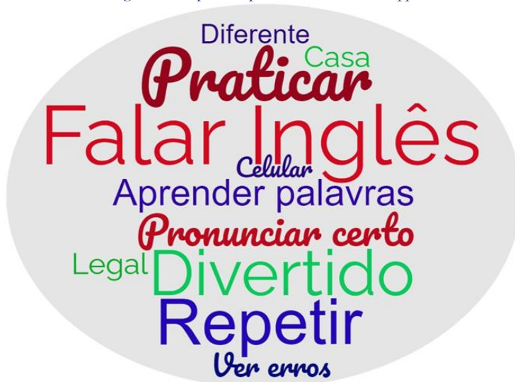
Figura 3: Aspectos positivos do WhatsApp

Na questão aberta do questionário, os alunos elencaram um ponto positivo e um ponto negativo em relação ao uso do WhatsApp nas atividades. Estes dados foram analisados por meio da ferramenta WordClouds . A primeira nuvem de palavras, apresentada na Figura 3, representa os pontos positivos listados pelos estudantes; a segunda, na Figura 4, os pontos negativos.