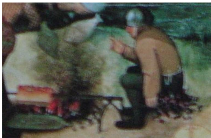
Fig. 3: "Sentar-se em brasas", com extrema impaciência e “Colocar lenha na fogueira”.