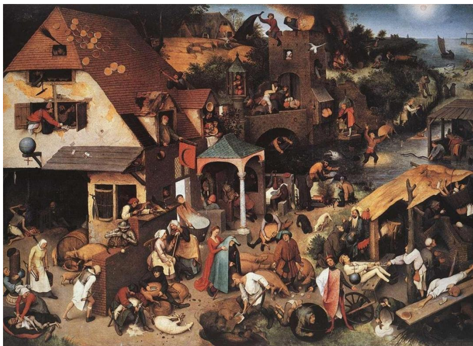
Fig. 1: Provérbios Flamengos , Pieter Bruegel 1559 - 1,16 x 1,62 m; óleo sobre painel de madeira – Staatliche Museum, Berlim.

Em Provérbios Flamengos , provérbios tão conhecidos e até hoje utilizados são retratados ao pé da letra, e todos juntos. Difícil para qualquer observador não se surpreender com a expressão artística ali colocada; ao nos aproximarmos o foco da visão, destacam-se corpos em posição que parecem movimentar a cena, a qualquer momento; expressões faciais e gestos quase concatenados com provérbios que conhecemos literalmente ou por sentidos aproximados; jogo de luz, sombra e cores que nos remetem a espaços que podemos “identificar” independente de temporalidades definidas.