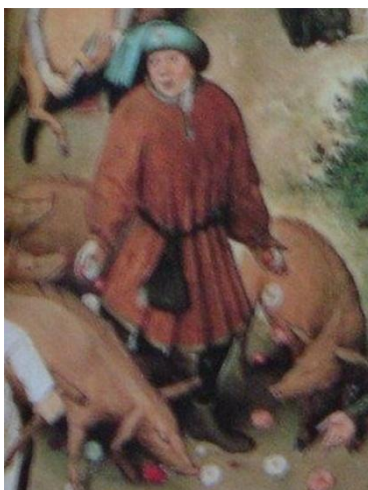
Fig. 2: “Jogar rosas aos porcos” ou como no provérbio bíblico, jogar pérolas aos porcos

tela suas impressões. Apresentam-se abaixo alguns dos recortes realizados por alguns desses estudos: