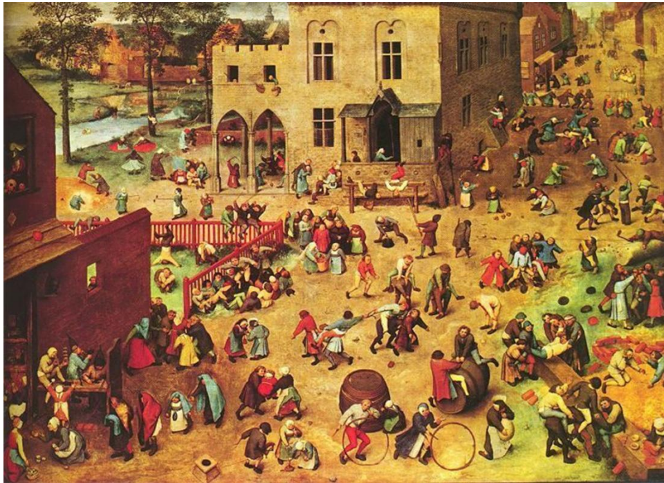
Fig. 6: Jogos Infantis – Pieter Bruegel (118 x 161 cm; 1560). Kunsthistorisches Museum, Viena. Fonte: Gênios da Pintura. Vol. 8.

As brincadeiras são bastante conhecidas, e podem ser identificadas com facilidade, porém, a forma como o pintor as apresenta é extremamente imaginativa, porque faz o pensamento acelerar em muitas e diversas direções. Mais uma vez, a cena parece abrir-se num movimento de corpos e gestos a qualquer instante, pondo o espectador na relação direta com o quadro, ou com o tema, ou com os jogos brincantes ali apresentados. Tal possibilidade movimenta o pensamento dos educandos, das educadoras, das pesquisadoras aqui envolvidas.