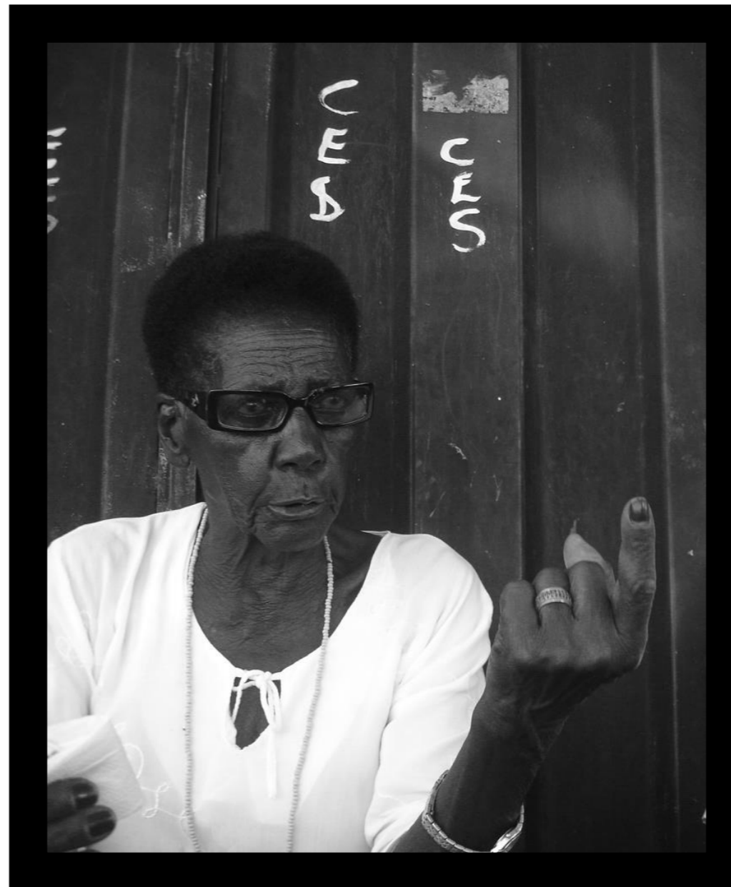
Tiana sempre contando a "verdadeira história do Brasil" (Bom Despacho, 2015)