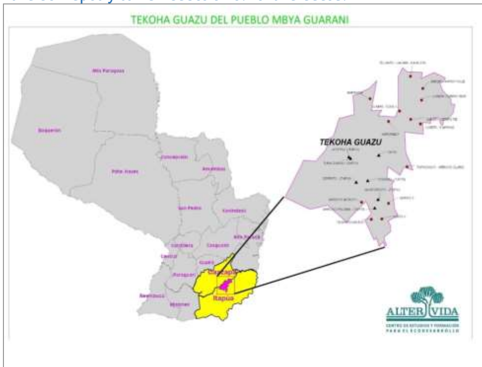
Fig. N° 1: Zona de mapeo y comunidades en el Tekoha Guasu .

En 2012, 13.093 ha, no contiguas, se encuentran a nombre de las comunidades mbyá. ACIDI y TYJP reivindican unas 100.000 ha; aclaran que su territorio incluye y supera el área decretada como RPNSR.