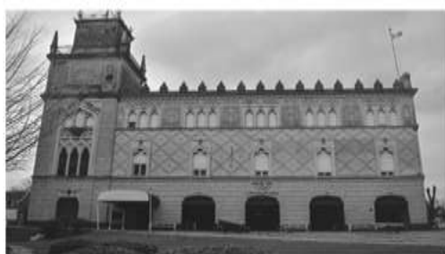
Club Canottieri Italiani (1910)