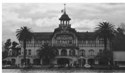
Club de Regatas La Marina (1927)