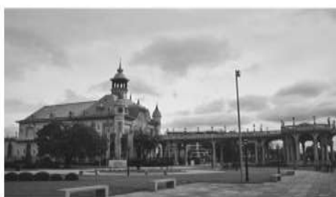
Ex Tigre Club (1910)