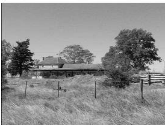
Figura 3 - Antigua estación de tren