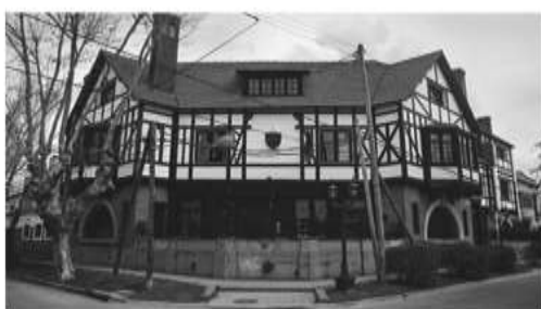
Rowing Club Argentino (1922)