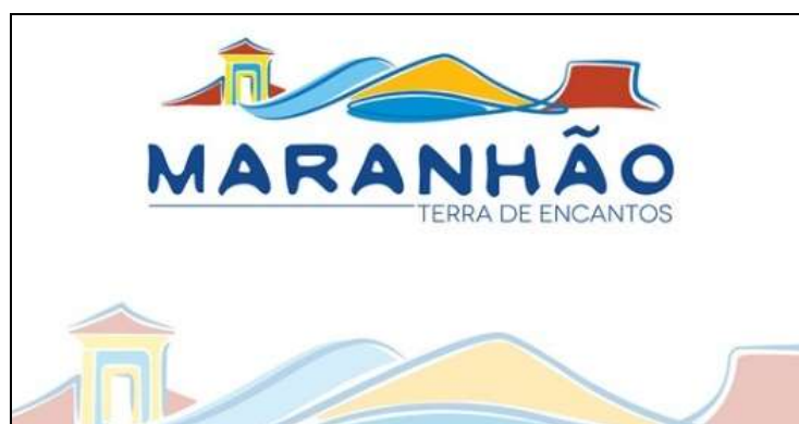
Figura 2 - Marca turística