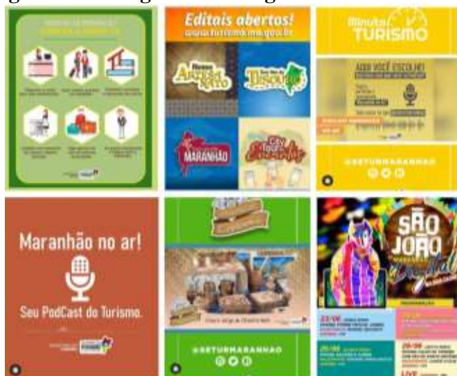
Figura 3 - Postagens do Instagram @seturmaranhao

Em relação ao conteúdo das imagens e vídeos utilizados nas postagens, no período analisado, não obedecem a uma temática específica, apresentam, em sua maioria, comunicados das medidas preventivas contra a Covid-19, postagens concernentes aos programas lançados (Nosso Artesanato, Desvenda Maranhão, Tour Ilha do Tesouro e City Tour de Encantos), das séries do Minuto Turismo, Maranhão no Ar e Artesões do CEPRAMA e postagens referentes ao São João (figura 3).