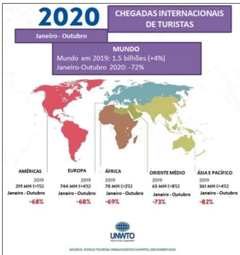
Figura 1 - Fluxo de turistas entre janeiro e outubro de 2020