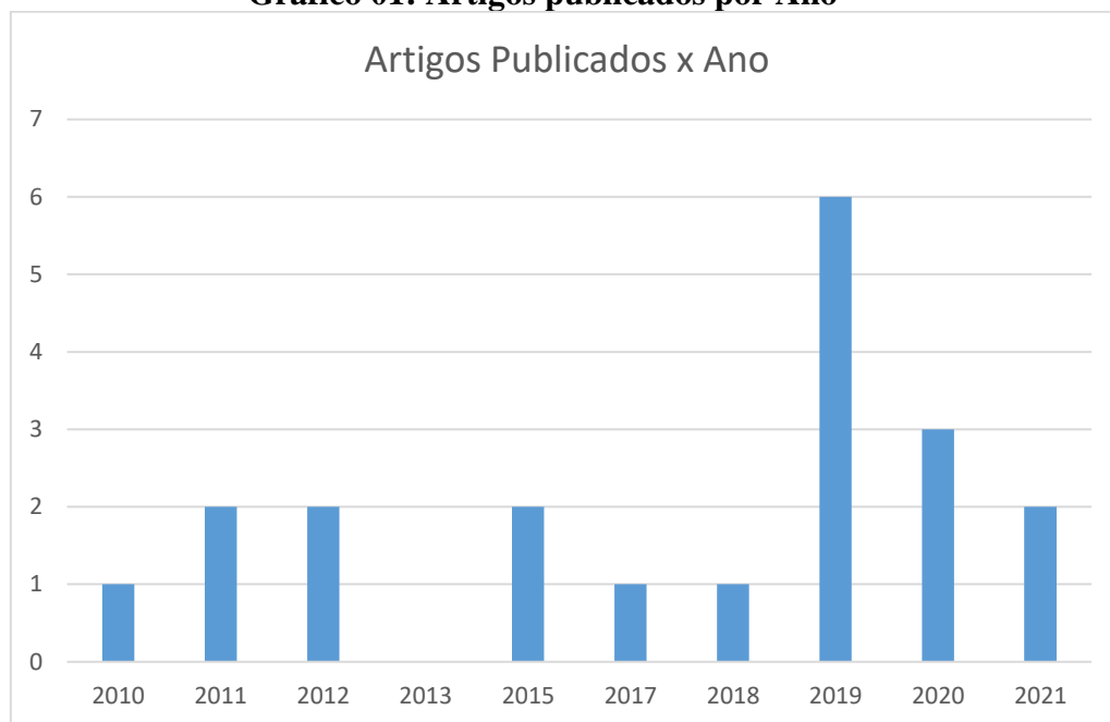
Gráfico 01: Artigos publicados por Ano