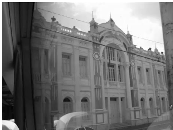
Figura 7 – Palácio Felipe Camarão fotografado da janela de um ônibus de Turismo