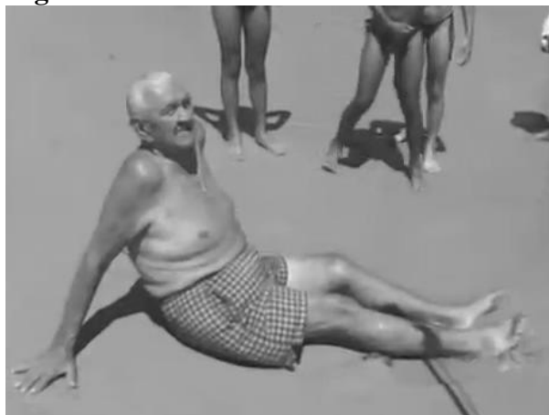
Figura 5 – Idoso tomando banho de sol e mar