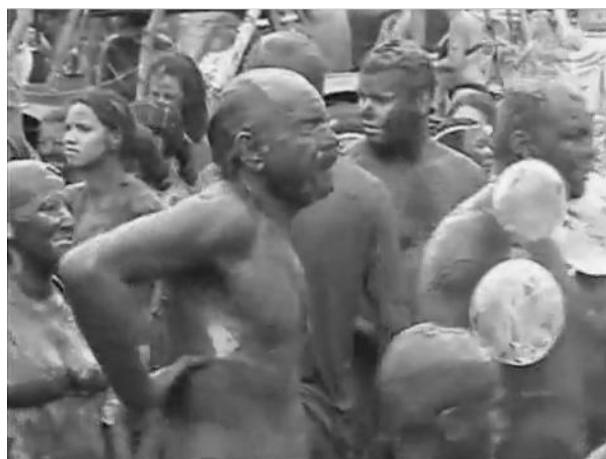
Figura 6 – Foliões do Bloco do Cão durante o Carnaval