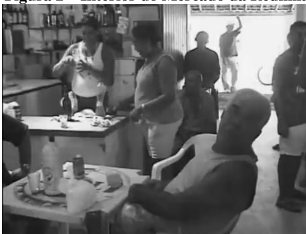
Figura 2 – Interior do Mercado da Redinha