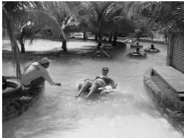
Figura 4 – Turista em parque aquático de Maracajaú (Maxaranguape)