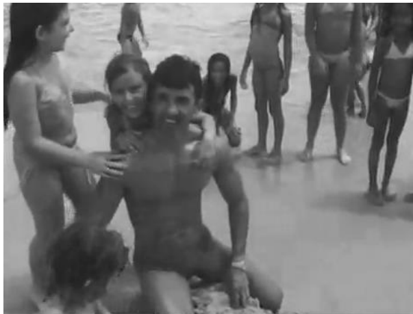
Figura 3 – Pais e filhos na Praia da Redinha