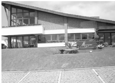
Figura 1 - Restaurante de Cozinha Internacional

Apesar da concentração dos frequentadores dentro e no seu entorno, atualmente pode-se contar ainda com mais algumas barracas e quiosques que vieram com a urbanização pública de parte da praia (calçadão, trapiche e algumas áreas de estacionamento público), possibilitando o serviço de A&B mais adequado, acrescido da facilitação de acesso à praia que foi melhor viabilizado com a inauguração da Ponte Newton Navarro em novembro de 2007. Apesar disso, o público que frequenta a praia ainda tem origem normalmente apenas de bairros mais populares da cidade – não sendo a região sistematicamente turística.