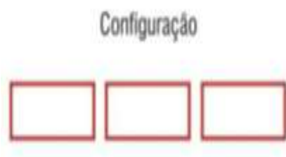
Figura 1: Multidisciplinaridade

Carlos (1995) representa a multidisciplinaridade da seguinte forma (figura 1):